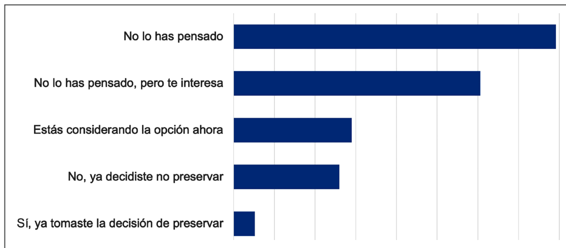
Figura 3: Planes de preservación de la fertilidad. Resultados a la pregunta "Las mujeres pueden decidir si desean preservar la fertilidad en diferentes momentos de sus vidas. En este momento, ...dirías que?"

la fecundidad. Las respuestas que indicaban un mayor conocimiento provenían de estudiantes de ciencias de la salud y psicología. En relación a ese grupo de estudiantes, el estudio reveló que las estudiantes del área de las ciencias sociales tienen un conocimiento significativamente menor en relación a la fertilidad femenina, ya que, entre otras afirmaciones, las estudiantes estaban mayormente de acuerdo con las afirmaciones "la edad ideal para congelar óvulos es después de los 35 años" y "en estos días, una mujer de 40 años tiene una probabilidad similar de quedar embarazada que una mujer de 30 años".