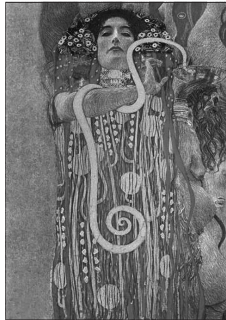
Figura 3. Gustav Klimt - Higea (Detalle de "Medicina").