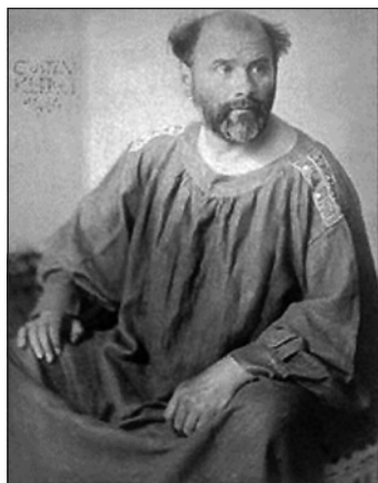
Figura 1. Gustav Klimt. En: http://artofgustavklimt.blogspot.com.ar/2008/10/art-of-gustav-klimt.html ; consultado 10/3/2013.

Klimt se transformó en un pintor simbolista y uno de los más conspicuos representantes del movimiento de la "Secesión vienesa", parte de lo que hoy llamamos "modernismo". Uno de los primeros grupos que se rebelaron contra las normas académicas y tradicionales ("secesionistas") sería el grupo literario "Joven Viena", pero la verdadera "Secesión" se gestó en la Casa de los Artistas, única asociación de artistas de Viena que organizaba temporalmente exposiciones para mostrar las creaciones de sus miembros, exposiciones que contaban con un jurado que seleccionaba a los artistas participantes. Los miembros antiguos no permitían incorporar en las muestras obras de artistas que tuvieran una visión diferente y, por supuesto, no se permitía la exhibición de obras realizadas por artistas extranjeros, canalizando las muestras de manera casi exclusivamente comercial 2 .