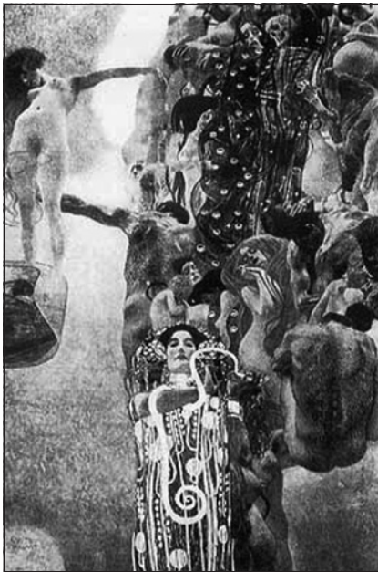
Figura 2. "Medicina": óleo sobre tela 430 x 300 cm. En: http://lacomunidad.elpais.com/psicoanalisis/2009/1/19/entrevista-melia-diez-sobre-psicoanalisis-del-programa-tv; consultado 10/3/2013.

La composición está presidida por Higea, que dio origen a la palabra "higiene", diosa de la salud e hija de Esculapio, ataviada con una larga túnica y con una larga serpiente enroscada en su brazo derecho que bebe de su copa, en su mano izquierda. Mira de frente al espectador, como si nos obligara a reconocer la visión existencial que aparece a sus espaldas con adornos circulares, rodeadas de sensuales mujeres desnudas, ancianos, hombre y niños, destacando la mujer embarazada (antecedente directo de otra obra de Klimt, "La esperanza") que se sitúa junto a la Muerte. La humanidad está perdida en el espacio. Klimt recurrió una vez más al sufrimiento humano para reseñar la separación entre la ciencia y la humanidad.